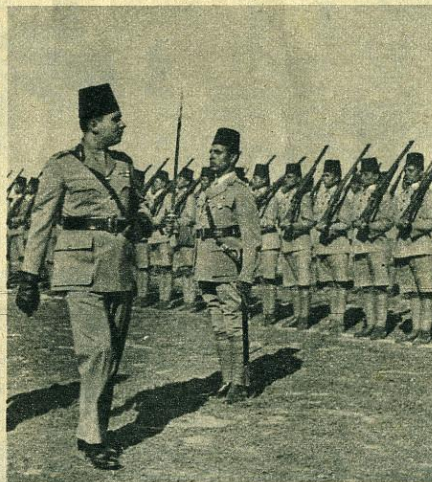
Son armée : Elle a été dans toutes les crises fidèle et dévouée à la royauté. Mais la défaite dans la guerre de Palestine a fait naître chez les officiers les premières critiques contre le régime. C'est l'armée qui détrônara Farouk.