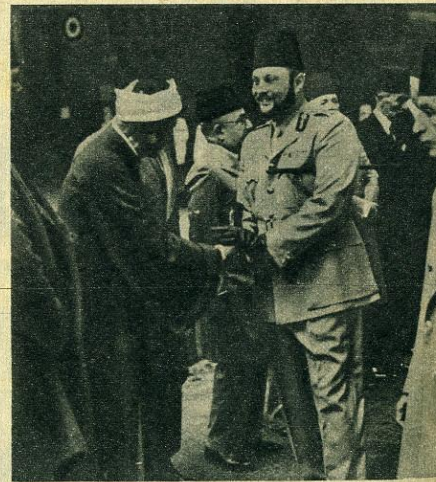
Son ambition : Il rêve de devenir le chef spirituel de tous les musulmans et se laisse pousser la barbe des imans (guides religieux). Il se fait saluer par la foule : « Vive le roi Farouk, le Calife. » Les autres souverains sont hostiles.