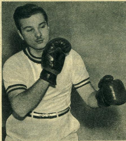
Son premier combat : A l'Académie militaire royale de Woolwich (Angleterre) il reçoit une éducation occidentale. Le prince Freddie, comme l'appellent ses camarades, pratique à 15 ans tous les sports : boxe, tir, natation, tennis.