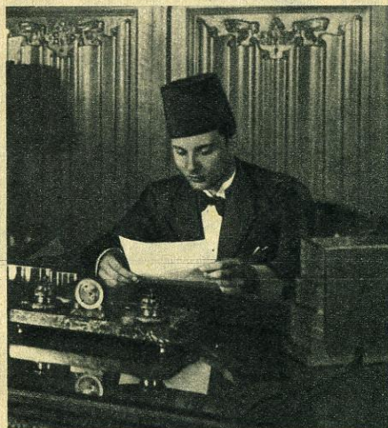
Son avènement : Il monte sur le trône d'Égypte à 16 ans, à la mort de son père, Fouad. C'est un garçon mince, sérieux, plein de bonnes intentions. Il conserve auprès de lui le précepteur anglais qu'il avait depuis son enfance.