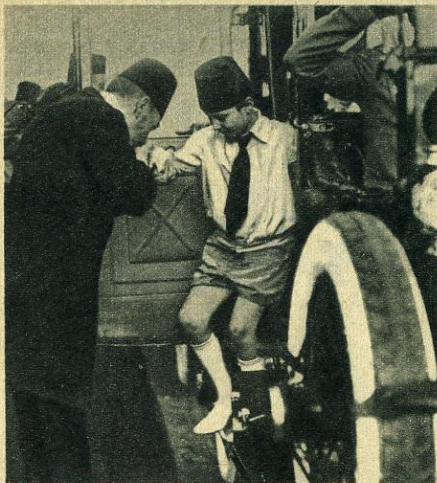
Son premier baise-main. Il a 11 ans. Par son père il descend d'un aventurier albanais proclamé pacha d'Égypte en 1806 ; par sa mère d'un colonel français, officier dans l'armée khédivale. Il n'a pas une goutte de sang égyptien.